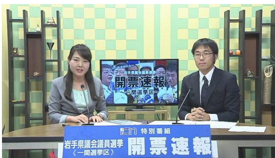
（図 1）ライブ配信された選挙速報番組

今回は、「地もっティオ」にて、一関選挙区のうち CATV 視聴不可エリアに位置する各選挙事務所などに、接戦となった選挙速報の様態を約 3 時間に渡って配信しました。CATV 視聴不可エリアでは初となった当該試みは、ケーブルテレビの特性を活かした地域情報発信の手段として、今後ますますの活用が期待されています。ICN は、行政情報の他、地域イベントなどの様態をライブ配信するほか、2015 年 12 月の本サービス開始以降は、コミュニティチャンネルを常時視聴できるよう、ケーブルテレビ幹線が敷設されていない CATV 視聴不可エリアのお客様を中心に「地もっティオ」を提供していく予定です。